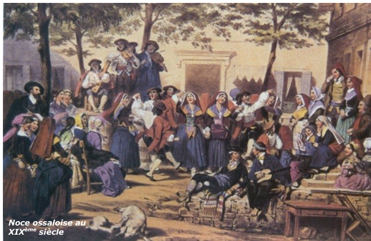
Noce ossaloise au XIX ème siècle

Durant la première moitié du XIX ème siècle le Béarn s'appauvrit, il n'y a plus de commerce avec l'Espagne, l'agriculture est très pauvre. Les départs des Béarnais vers les Amériques se font alors plus nombreux.