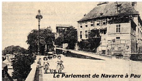
Le Parlement de Navarre à Pau

En 1572 Henri III de Navarre à Paris échappe de peu au massacre des protestants. Il se convertit au catholicisme, devient Henri IV roi de France. Il accorde la liberté du culte aux protestants par l'Edit de Nantes et la liberté de culte aux catholiques par l'Edit de Fontainebleau. Il laisse la régence du Béarn et de la Navarre à Catherine de Bourbon sa sœur. Le royaume de Béarn-Navarre reste distinct du royaume de France.